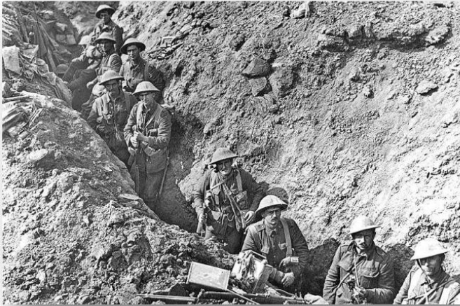
Doc B : les tranchées pendant la 1 ère guerre mondiale

Comme l'armée allemande se bat sur deux fronts : la Russie et la France, elle essaye de s'imposer rapidement par une offensive surprise contre la France. Mais elle est arrêtée et le front se stabilise. Les armées françaises et allemandes creusèrent des tranchées pour se protéger et défendre leurs positions.